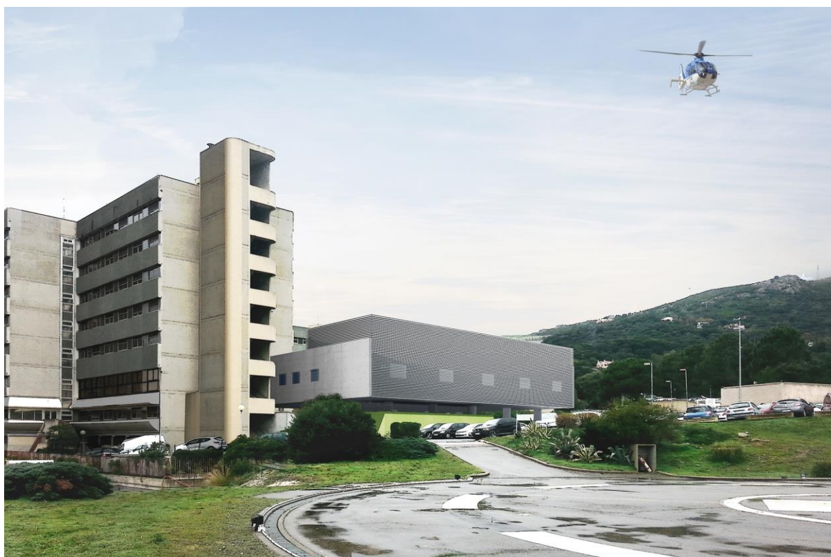
Esquisse de l'extension du nouveau bloc opératoire (bâtiment gris)