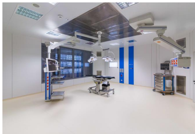
Aménagement des salles de bloc opératoire après travaux

Le cout total de cette opération de travaux s'élève à 10 millions d'euros, financés à 100% par l'Etat par subvention du FMESPP.