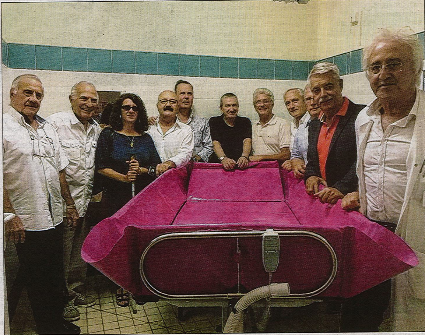
Le chariot de douche dédié aux personnes handicapées ou en surpoids a officiellement été remis hier au centre hospitalier de Bastia.

Chaque année, les clubs choisissent une cause à défendre et s'organisent, avec le soutien de sponsors*, pour soutenir par exemple le travail des Restos du Cœur, des sauveteurs de la SNSM, etc. Des partenaires qu'ils